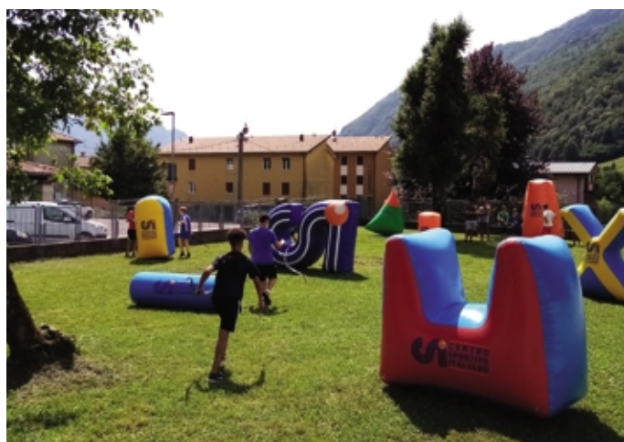
Uno scatto durante il Laboratorio Estivo di Spacelab a Villa d'Ogna nel 2020

Spacelab. Prima puntata sul resoconto dello studio nei 5 ambiti provinciali