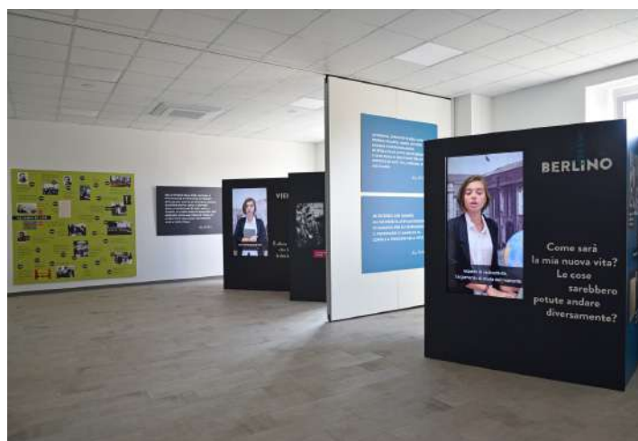
Nelle foto la benedizione dei locali rimessi a nuovo ed utilizzati, alcuni particolari dei locali stessi (con la mostra LISE CHI?) ed il nuovo tappeto del campo di calcio.