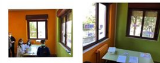
Elezioni CRA 2021/2022